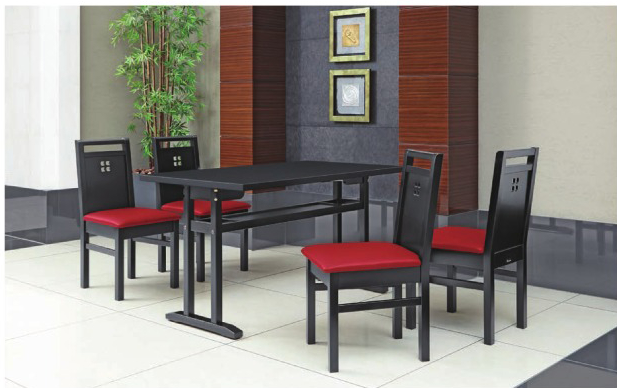
脚部 4720-4726 天板 9225 HLB 棚付大間B テーブル W1200 × D750 × H700mm [P141 記載]