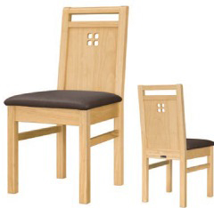
1096-1779 隠岐 N 椅子 張地: 色舞 SH-12 (白ランク)