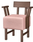
1193-1961 玄海 D 椅子 1531 玄海 ID 背もたれ 1541×2 玄海 D アーム×2 張地: シルクレースタルUP-773 (Bランク)