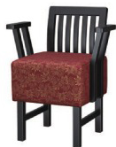
1393-1961 玄海 B 椅子 1522 玄海 II B 背もたれ 1542×2 玄海 B アーム×2 張地: 松葉 L UP-1000 (Cランク)