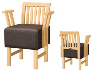
1093-1961 玄海 N 椅子 1520 玄海 II N 背もたれ 1540×2 玄海 N アーム×2 張地: 色書 SH-12 (Bランク)