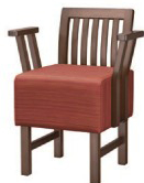
1193-1961 玄海 D 椅子 1521 玄海 II D 背もたれ 1541×2 玄海 D アーム×2 張地: テコア L-8145 (Bランク)