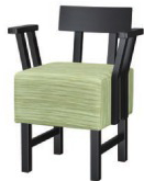
1393-1961 玄海 B 椅子 1532 玄海 IB 背もたれ 1542×2 玄海 B アーム×2 張地: テコア L-8148 (Bランク)