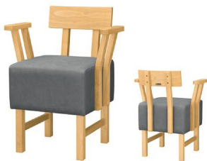
1093-1961 玄海 N 椅子 1530 玄海 IN 背もたれ 1540×2 玄海 N アーム×2 張地: デニム II UP-873 (Bランク)